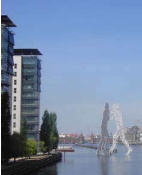
Kanal-Kunst – in Berlin gibt es immer was Neues