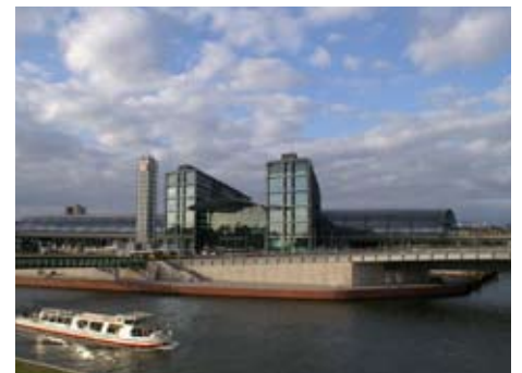
Der neue Hauptbahnhof

Bei fester Buchung ist eine Anzahlung in Höhe von 20% des Reisepreises fällig. Den Rest erwarten wir 14 Tage vor Antritt der Reise. Wir werden jede feste Buchung umgehend schriftlich bestätigen.