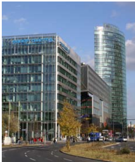
Potsdamer Platz – nur 20 Minuten zu Fuß