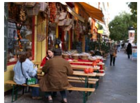
Bummeln und lecker Essen in der Bergmannstraße

Alle diese Bilder wurden an einem Nachmittag im Herbst 2006 bei einer Rundfahrt mit dem Fahrrad gemacht.