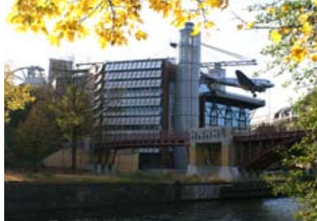
Technikmuseum – gleich um die Ecke