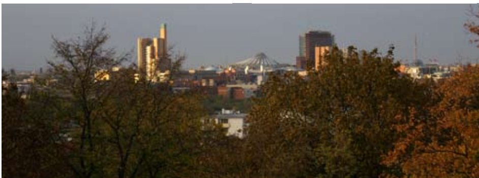
Blick vom Kreuzberg zum Potsdamer Platz

Alle diese Bilder wurden an einem Nachmittag im Herbst 2006 bei einer Rundfahrt mit dem Fahrrad gemacht.