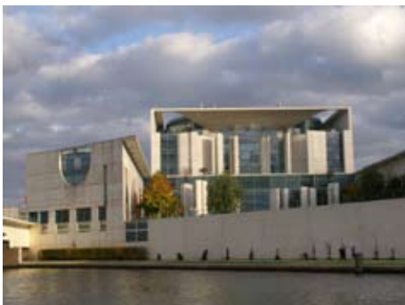
Bundeskanzleramt – gegenüber ein netter Biergarten