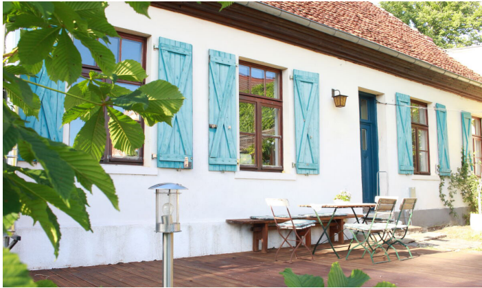
Die große sonnige Terrasse mit Sitzmöbeln und Grill geht ebenerdig in den Garten mit Weitblick über.