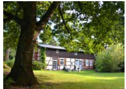
Ferienhaus "Alte Linde", Bäckern