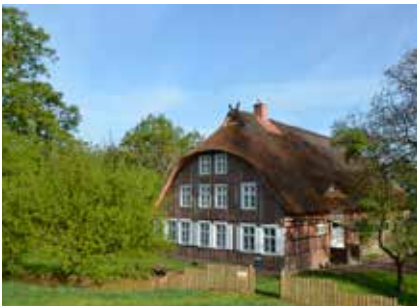
Ferienhaus Deichkind, Mödlich

Himmlische Ferien in historischen Häusern!