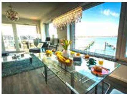
FeWo Mirador, Hafenspitze Wismar