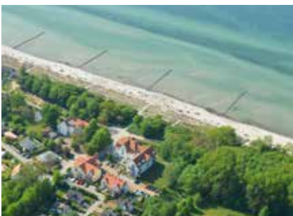
FeWo Inseltraum, Insel Poel